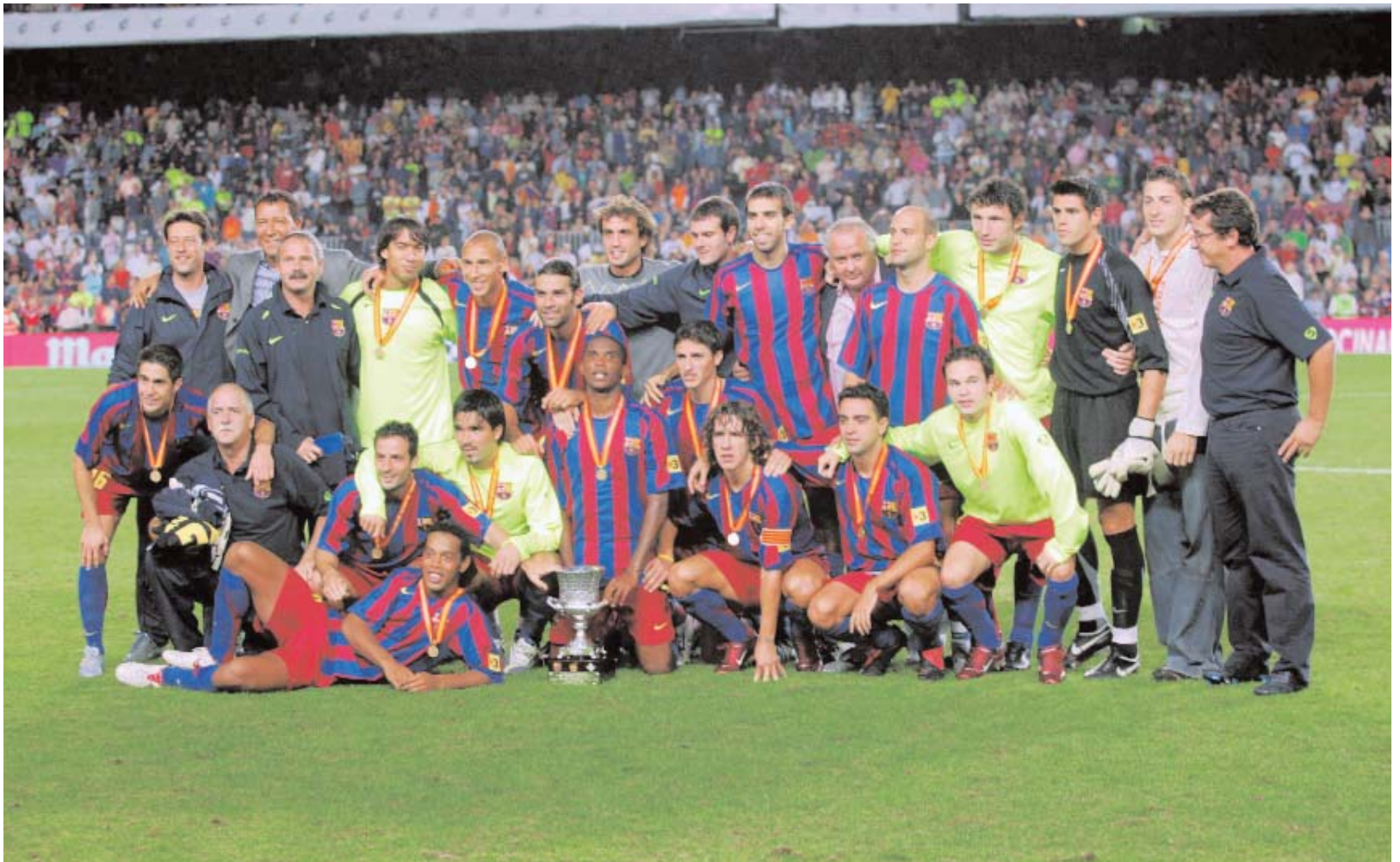
Gewinn der spanischen Liga 2004/2005.

weiteren Sportarten, die zum FC Barcelona gehören, wie etwa Basketball oder Handball. Aus 96 000 Euro Sponsoringgeldern pro Jahr machte das neue Marketingteam zwei Millionen Euro. Mit dabei und in den Medien am meistens sichtbar ist die Winterthur Versicherung, die als Hauptsponsor der erfolgreichen Basketball-Mannschaft des Barça auftritt.