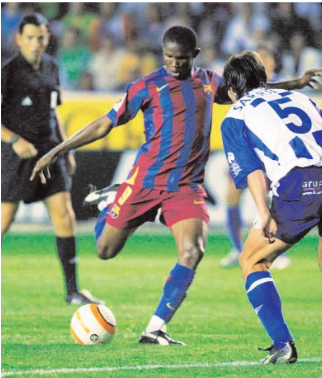
Star-Club ohne Leibchenwerbung.